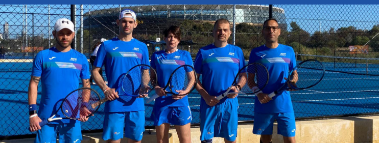
La squadra italiana di tennis ai mondiali WTG di Perth 2023