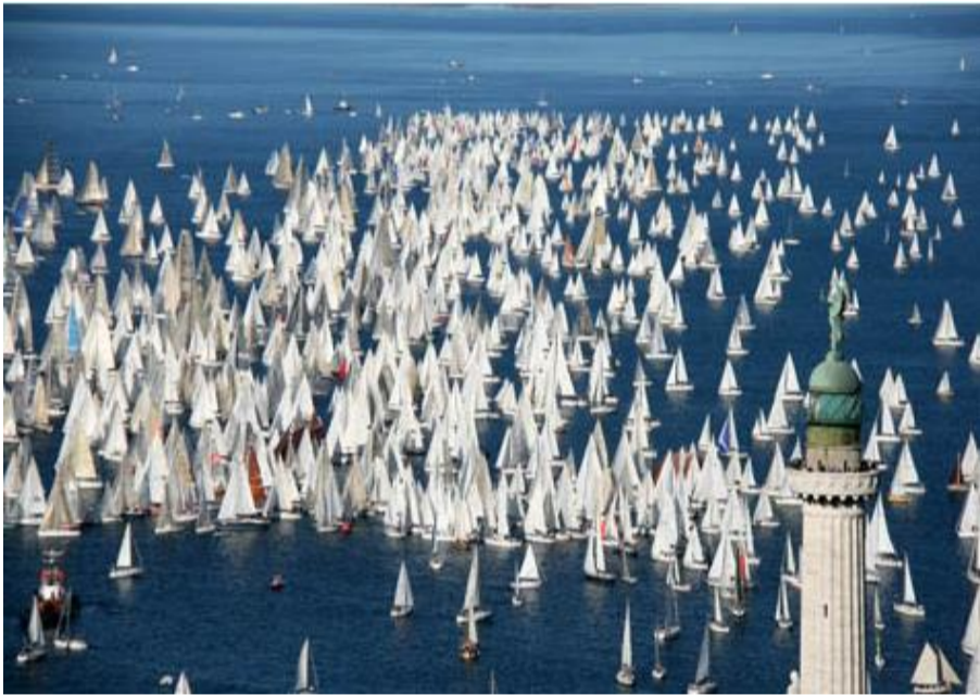
Trieste città della BARCOLANA